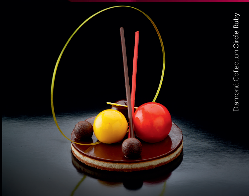
Diamond Collection Circle Ruby