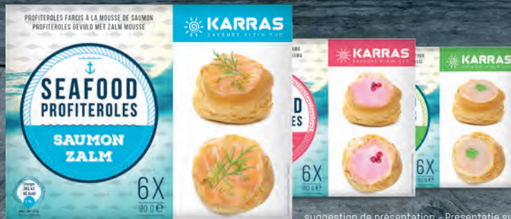
suggestion de présentation - Presentatie suggestie