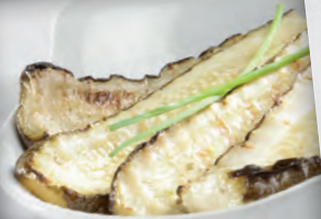
COURGETTES GRILLÉES GEGRILLDE COURGETTEN