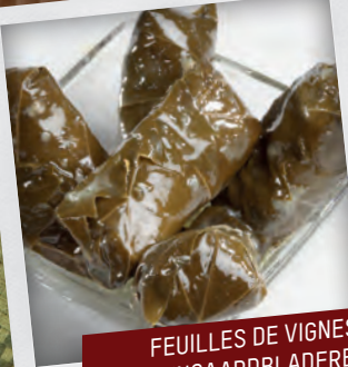
FEUILLES DE VIGNES WIJNGAARDBLADEREN