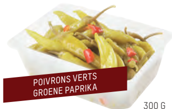
POIVRONS VERTS GROENE PAPRIKA