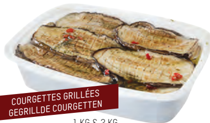
COURGETTES GRILLÉES GEGRILLDE COURGETTEN