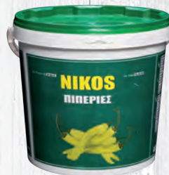
POIVRONS VERT GROENE PEPEPS 7 KG