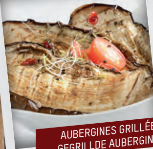
AUBERGINES GRILLÉES GEGRILLDE AUBERGINES