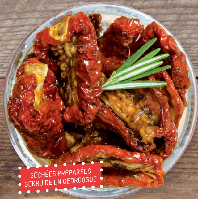
SÉCHÉES PRÉPARÉES GEKRUIDE EN GEDROOGDE