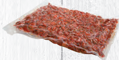
TOMATES SEMI-SÉCHÉES HALF GEDROOGDE TOMATEN poche 10 KG