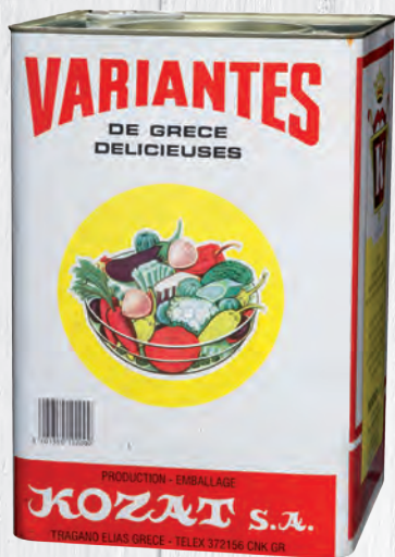
JARDINIÈRE DE LÉGUMES TUINSLAATJE EXTRA-JUMBO 12 KG

Tomates / tomaten - poivrons / pepers fromage / kaas leuko tyri - olives / olijven