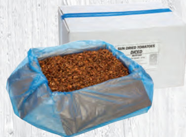
DÉS DE TOMATES SÉCHÉES BLOKJES VAN GEDROOGDE TOMATEN CARTON 10 KG