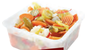
JARDINIÈRE DE LÉGUMES TUINSALADE