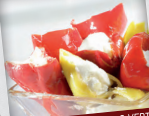
POIVRONS ROUGES & VERTS, FETA GROENE & RODE PEPERS, FETA