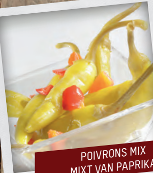
POIVRONS MIX MIXT VAN PAPIKA