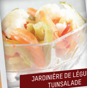
JARDINIÈRE DE LÉGUMES TUINSALADE