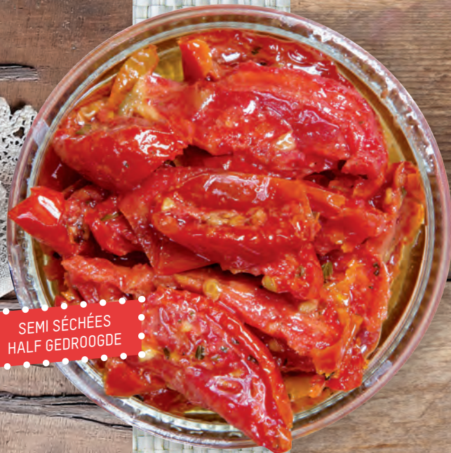
SEMI SÉCHÉES HALF GEDROOGDE