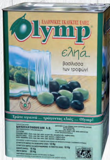
OLIVES FOURÉES PAPRIKA OLIJVEN GEVULD MET PEPER EXTRA-JUMBO 10 KG