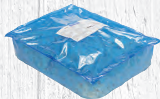
FROMAGE LEUKO TYRI CUBE KAAS LEUKO TYRI CUBE SAC 5 KG