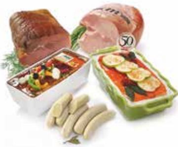
LA GAMME TRADITIONNELLE