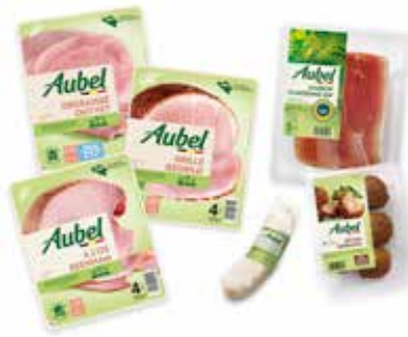
NOTRE MARQUE LIBRE-SERVICE