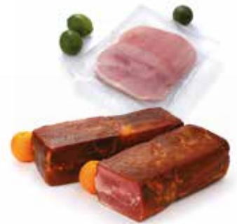
UNE GAMME FOOD SERVICES & INDUSTRIEL