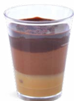
CHOCOLAT NOIR DULCE DE LECHE - GANACHE

LEMON CHEESECAKE COOKIE CRUMBLE - GUAVA 703136810220