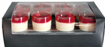
8-PACK MASCARPONE - FRAMBOISE]

8-PACK DARK CHOCOLATE/WHITE CHOCOLATE - GANACHE 711118510608