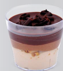
CHOCOLAT NOIR PRALINÉ