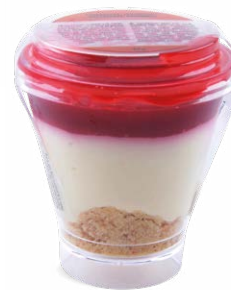
CHEESECAKE À LA FRAMBOISE

CHEESECAKE WITH RASPBERRIES 715124640215