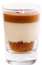
MASCARPONE - BRISURES DE SPECULOOS

MASCARPONE SPECULOOS CRUMBLE 701122510224