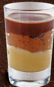
MOUSSE CHOCOLAT NOIR VALRHONA MANJARI 64% GANACHE & CHOCOLAT DULCEY®

DARK CHOCOLATE MOUSSE VALRHONA MANJARI 64% 701137810224