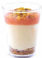
CHEESECAKE CITRON SABLÉ - GOYAVE

LEMON CHEESECAKE COOKIE CRUMBLE - GUAVA 703136810220