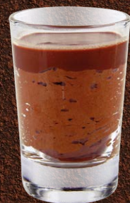
MOUSSE CHOCOLAT NOIR VALRHONA MANJARI 64%

DARK CHOCOLATE MOUSSE VALRHONA MANJARI 64% 701137810224