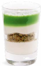
FROMAGE BLANC PISTACHE

LEMON CHEESECAKE COOKIE CRUMBLE - GUAVA 701136810224