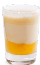
CHEESECAKE - ANANAS CHOCOLAT BLANC

FROMAGE FRAIS - HONEY NUTS - RASPBERRIES 701118410224