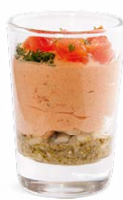
TOMATE PÂTES AU PESTO