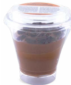
CHOCOLAT - CARAMEL AU BEURRE SALÉ

CHOCOLATE - CARAMEL WITH SALTED BUTTER 715122440215