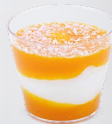
CRÉMEUX COCO COULIS DE MANGUE