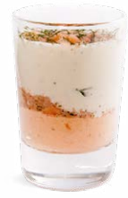
SAUMON - TARTARE DE SAUMON - CRÈME D'ANETH