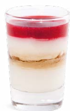
FROMAGE BLANC - MIEL NOIX - FRAMBOISE

FROMAGE FRAIS - HONEY NUTS - RASPBERRIES 701118410224