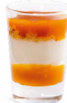
CRÉMEUX COCO COULIS DE MANGUE

VANILLA CREAM SALTED CARAMEL 701118210224