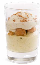
PETIT POIS - MENTHE POIS CHICHE - TANDOORI