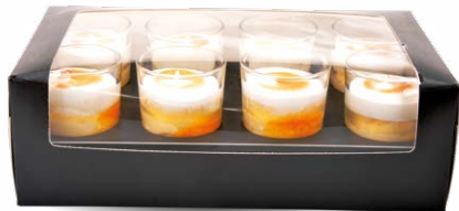
8-PACK PASSION - MERINGUE

8-PACK PASSION FRUIT - MERINGUE 711107110608