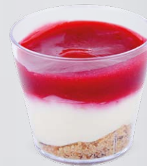
CHEESECAKE À LA FRAMBOISE

WHITE CHOCOLATE TRIO OF RASPBERRY 721132810220