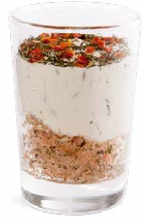
TARTARE DE SAUMON FROMAGE BLANC - ANETH