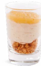
FOIE GRAS - POMME PAIN D'ÉPICES