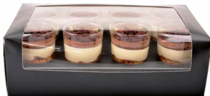
8-PACK CHOCOLAT NOIR/CHOCOLAT BLANC - GANACHE

8-PACK PASSION FRUIT - MERINGUE 711107110608