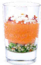
PATATE DOUCE QUINOA - FETA