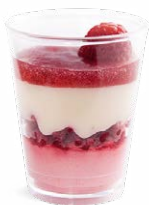
CHOCOLAT BLANC FRAMBOISE

DARK CHOCOLATE DULCE DE LECHE - GANACHE 703136910220