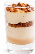
CRÉMEUX VANILLE CARAMEL SALÉ

VANILLA CREAM SALTED CARAMEL 701118210224