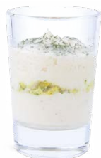
TARTARE DE CABILLAUD CURRY - CHOU-FLEUR