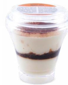
TIRAMISU - CAFÉ

CHEESECAKE WITH RASPBERRIES 715124640215