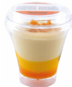
MANGUE - PASSION

CHOCOLATE - CARAMEL WITH SALTED BUTTER 715122440215