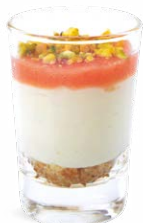
CHEESECAKE CITRON SABLÉ - GOYAVE

LEMON CHEESECAKE COOKIE CRUMBLE - GUAVA 701136810224