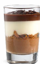
CHOCOLAT NOIR - CHOCOLAT BLANC - GANACHE

CHEESECAKE - PINEAPPLE WHITE CHOCOLATE 701131310224