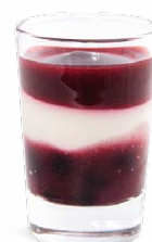
FROMAGE BLANC FRUITS DES BOIS

DARK CHOCOLATE WHITE CHOCOLATE - GANACHE 701118510224