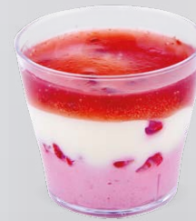
CHOCOLAT BLANC TRIO DE FRAMBOISE

WHITE CHOCOLATE TRIO OF RASPBERRY 721132810220