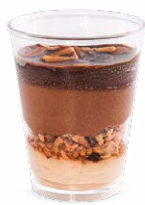
CHOCOLAT NOIR - PRALINÉ GANACHE

DARK CHOCOLATE - PRALINÉ GANACHE 703107310220