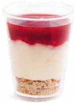
CHEESECAKE À LA FRAMBOISE

CHEESECAKE WITH RASPBERRIES 703124610220