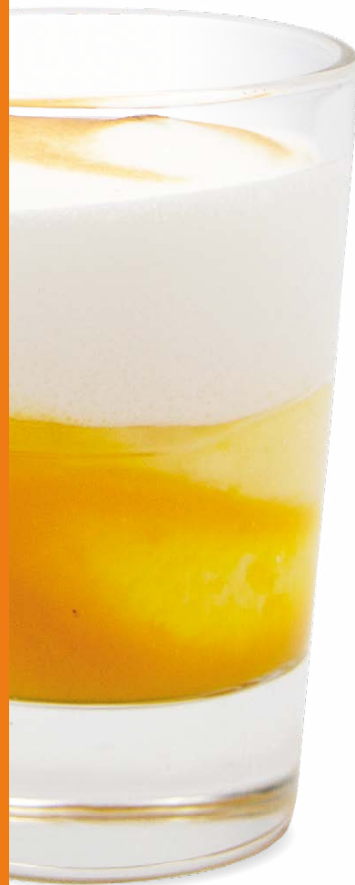
Table des matières Table of content

A new idea, a new concept, a new product? Contact us!