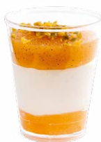
PANNA COTTA ABRICOT

CHEESECAKE WITH RASPBERRIES 703124610220