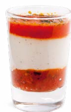
CHÈVRE - POIVRON CONFIT DE TOMATES

GOAT CHEESE - SWEET PEPPER CANDIED TOMATOES